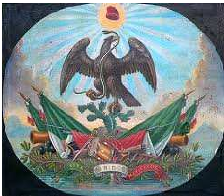
Águila republicana (Imagen de Internet. Google).

El 5 de diciembre de 1864 el Gobernador y Comandante Militar del Estado de Puebla, Gral. Fernando María Ortega, le otorga a la población de Xochiapulco la calidad política de Villa y el título de Villa del 5 de mayo . Además, también se les otorga a los poblados indígenas que para fines de 1855 eran conocidos en la Sierra Norte de Puebla como los indios cuatecomacos y que ocupan las tierras que hasta entonces habían pertenecido a la hacienda La manzanilla y el rancho Xochiapulco , el reconocimiento como Municipio Libre y políticamente autónomo de la que hasta entonces había sido su cabecera política, la Villa de Zacapoaxtla. Todo esto como reconocimiento a la participación de los habitantes indígenas nahuas de Xochiapulco tanto en la batalla del 5 de mayo de 1862 como en lo que iba hasta dicho momento de la guerra de Intervención Francesa (tres años). Pero aquí es necesario resaltar que a los entonces habitantes de Xochiapulco les cabe la gloria, muy rara entre todas las poblaciones de México, de haber conquistado sus títulos durante una guerra nada menos que en contra de la primera potencia mundial de su época, la Francia de Napoleón III, la cual había invadido la República Mexicana para someter a sus habitantes nuevamente a la esclavitud colonial.