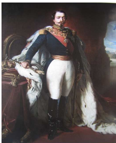
Napoleón III, emperador de Francia 1858-1870. Óleo sobre tela (Imagen digital)