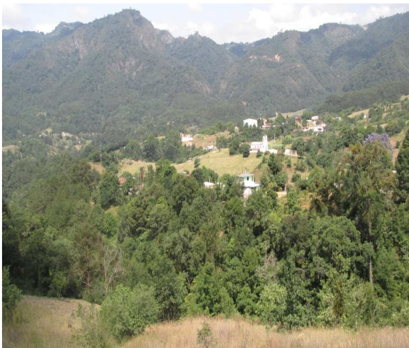
Exhacienda La Manzanilla (a varios minutos de Xochiapulco, sobre el camino a Yautetelco) (Imagen digital obtenida con la guía del Profr. Erasto Pérez Bedolla).

Como consecuencia de tres siglos de dominación colonial española, para mediados del siglo XIX todas las poblaciones de la Sierra Norte de Puebla, principalmente las indígenas, sufren la opresión de dos tipos de caciques o tiranos: los curas católicos y “la gente de razón”, llámense hacendados o autoridades, las cuales tienen a los indígenas cargados de innumerables contribuciones y siempre les niegan la justicia. Es en este contexto que para 1850 en el municipio de Zacapoaxtla se entabla un litigio entre el dueño español de la hacienda La Manzanilla y el rancho Xochiapulco .