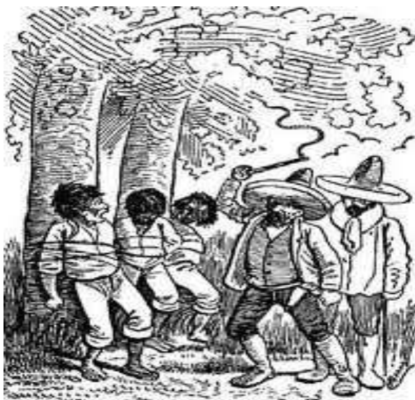
A mediados del siglo XIX, hacendados y autoridades “de razón” en la Sierra Norte de Puebla les niegan la justicia y tratan inhumanamente a los indígenas

Durante la época colonial un español rico le había comprado a la corona las tierras mencionadas, las cuales desde la época prehispánica habían pertenecido a los indígenas nahuas. Entre 1821 y 1850 el hacendado y sus sucesores se habían apropiado de éstas y otras tierras vecinas y habían convertido a los indígenas en peones acasillados en las tierras que sus propios ancestros les habían legado, dándoles además trato inhumano y cobrándoles fuertes cantidades cada que su ganado penetraba en las que los nuevos amos consideraban tierras de su propiedad. Los indígenas habían acudido ante las autoridades “de razón” de Zacapoaxtla y de San Juan de los Llanos clamando por justicia, pero fueron ignorados y tratados como criminales (apaleados, encarcelados o puestos en el cepo). En vista de que en el terreno político dichas autoridades pertenecían al partido reaccionario, los indios cuatecomacos buscaron apoyo en el partido contrario, el partido liberal, para reclamar la propiedad de sus tierras y un trato digno.