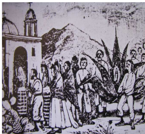
A mediados del siglo XIX, aprovechando la devoción e ignorancia de los indígenas serranos los curas tienen a éstos siempre cargados de innumerables contribuciones, las cuales son obligatorias (Imagen digital) (MARTÍN MORENO, Francisco. 2010).