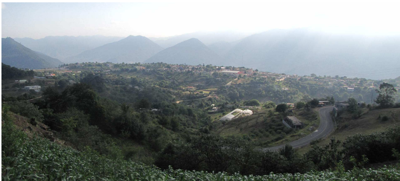
Vista actual de Xochiapulco (desde el camino de herradura en el cerro Zapotán, junto a la carretera hacia Zacapoaxtla) (Imagen digital obtenida con la guía del Profr. Erasto Pérez Bedolla).

Como consecuencia de tres siglos de dominación colonial española, para mediados del siglo XIX todas las poblaciones de la Sierra Norte de Puebla, principalmente las indígenas, sufren la opresión de dos tipos de caciques o tiranos: los curas católicos y “la gente de razón”, llámense hacendados o autoridades, las cuales tienen a los indígenas cargados de innumerables contribuciones y siempre les niegan la justicia. Es en este contexto que para 1850 en el municipio de Zacapoaxtla se entabla un litigio entre el dueño español de la hacienda La Manzanilla y el rancho Xochiapulco .